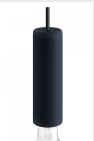
LINIOVÉ NEBO BODOVÉ ZÁVĚSNÉ SVÍTIDLO