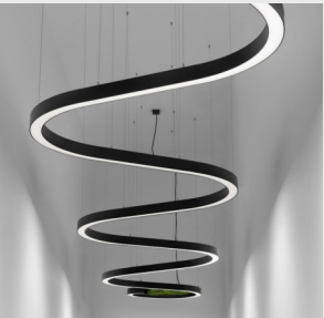
SESTAVA ORGANICKÝCH KŘIVEK