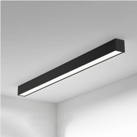
LINÉÁRNÍ SVÍTIDLO PŘÍSAZENÉ ČERNÉ