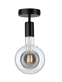
TUBUSOVÉ SVÍTIDLO BEZ ŽÁROVKY