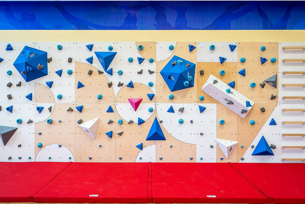
LEZECKÁ STĚNA - SPORT A ZÁBAVA