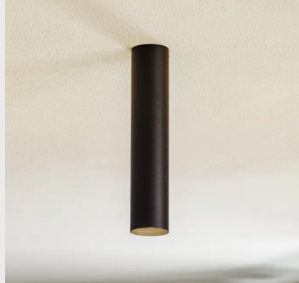
TUBUSOVÉ SVÍTIDLO BEZ ŽÁROVKY