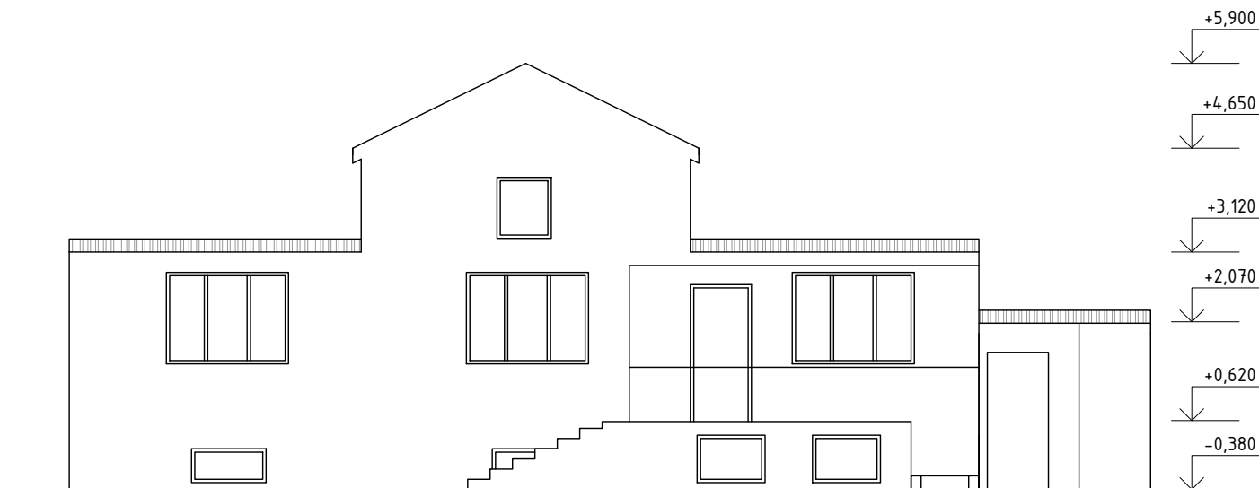
SO 02 - POHLED ZE DVORA