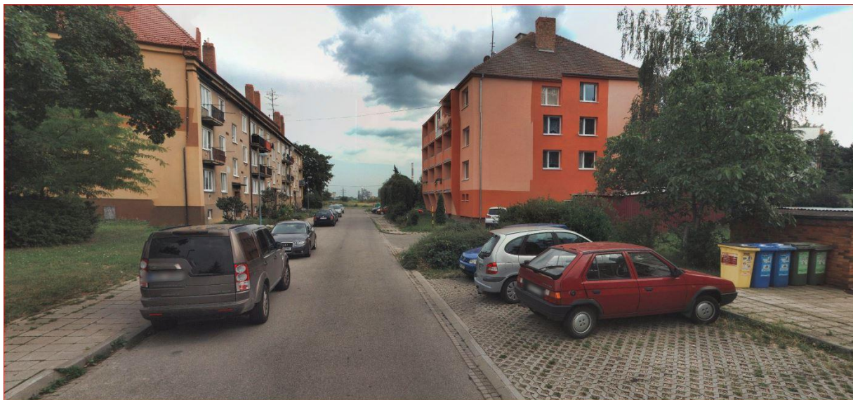
Obrázek 6 - stání na komunikaci, nedostatečná šířka komunikace