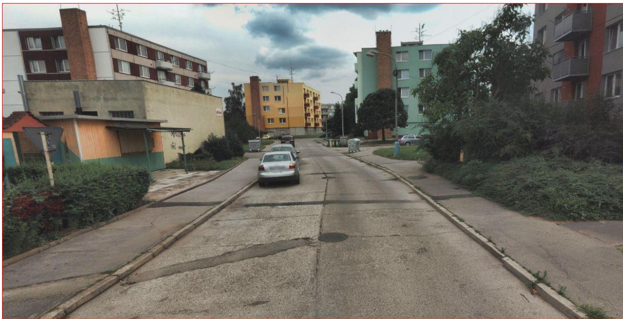
Obrázek 4 – ulice Budovatelská, nevyhovující povrch komunikace i chodníku