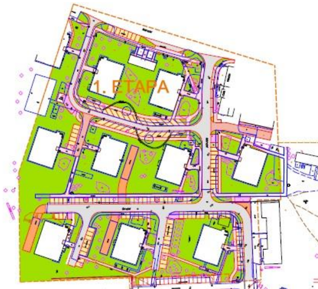
Obrázek 1 – návrh situace – etapa 1

v šířce 1,50 – 2,00 m. Dále dojde k rekonstrukci a zpevnění plochy ke garážím a bytovým domům č.p. 91 a 93. Dále dojde k rekonstrukci zpevněných pojízdných ploch pro vozidlo IZS z drenážní dlažby u domů č.p. 91, 93 a 87. V této etapě dojde i k rekonstrukci popř. vytvoření nových ploch pro kontejnery. Celkem v této etapě je navrženo 137 parkovacích míst. V této etapě je počítáno i s rekonstrukcí městského mobiliáře, veřejného osvětlení a obnovy stromů, keřů a zeleně.