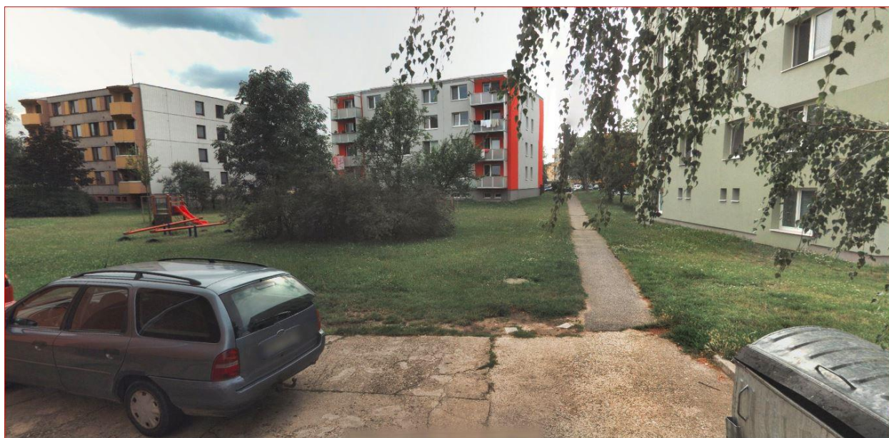
Obrázek 10 – nevyhovující stav chodníků a nevyhovující dětské hřiště

Na tomto sídlišti jsou pískoviště, avšak některá jsou už nevyužívána. Sportovní asfaltová plocha se nachází v blízkosti sídliště a to na rohu ulic Nádražní a Čs. armády. V blízkosti sídliště podél ulice Tylova se nachází nové dětské hřiště, avšak v blízkosti obytných domů chybí dětské hřiště a herní prvky pro malé děti. Nejsou zde ani odpočinkové plochy pro starší občany a matky s kočárky.