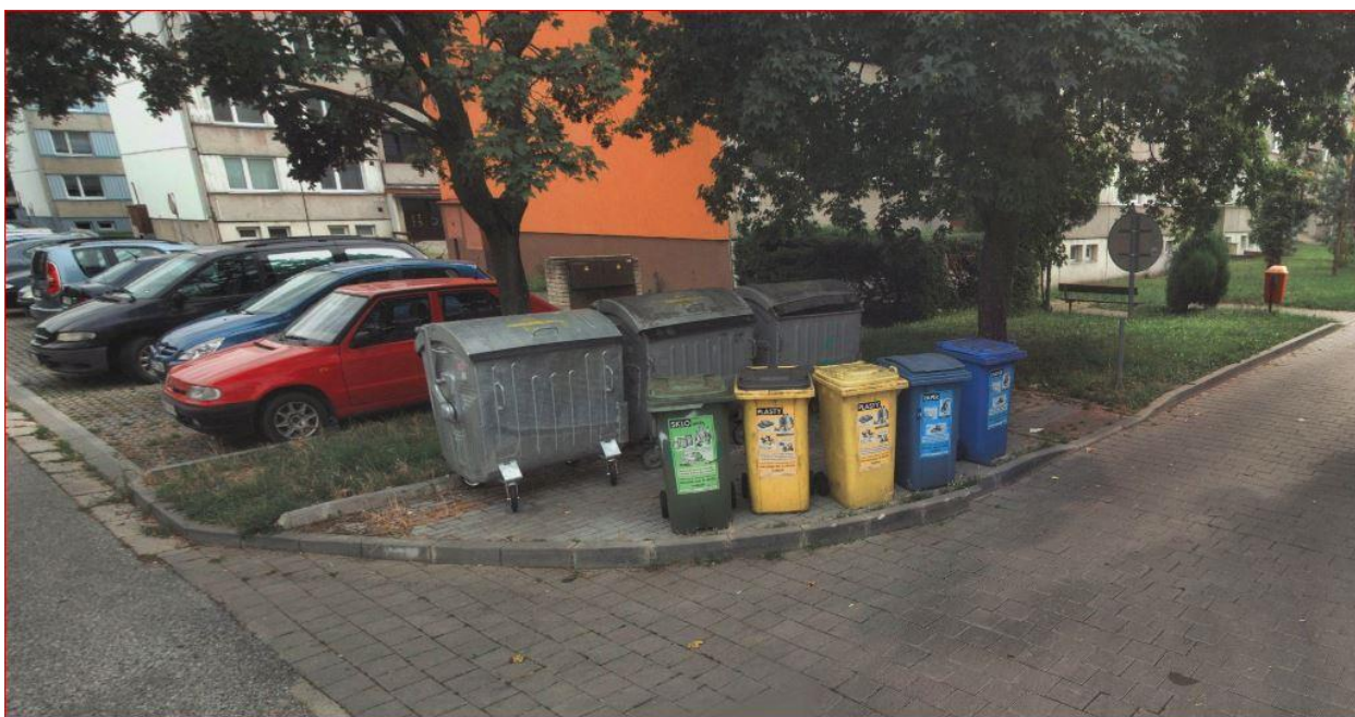
Obrázek 5 – nevyhovující zpevněné plochy pro kontejnery

Ve 2. etapě v r. 2021 , která by měla plynule navazovat na etapu první, bude rekonstruována jihozápadní část sídliště a prostor mezi ulicemi Budovatelská a Gagarinova. Bude zde vytvořeno víc parkovacích míst a nové plochy pro kontejnery. Parkování zde probíhá částečně na komunikaci a chodnících. Tato plocha bude upravena a doplněna zelení. Na sídlišti bude doplněn nový městský mobiliář, který bude sloužit pro odpočinek obyvatelstva. Přístupový chodník k bytovým domům podél stávající komunikace bude obnoven a předlážděn. Zaslepená komunikace vedoucí do vnitrobloku zůstane ve stávajícím šířkovém uspořádání a její povrch bude obnoven. Veřejné osvětlení bude rekonstruováno.