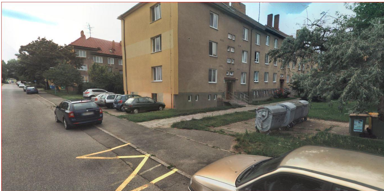
Obrázek 7 – špatný přístup ke kontejnerům, parkování částečně na chodníku