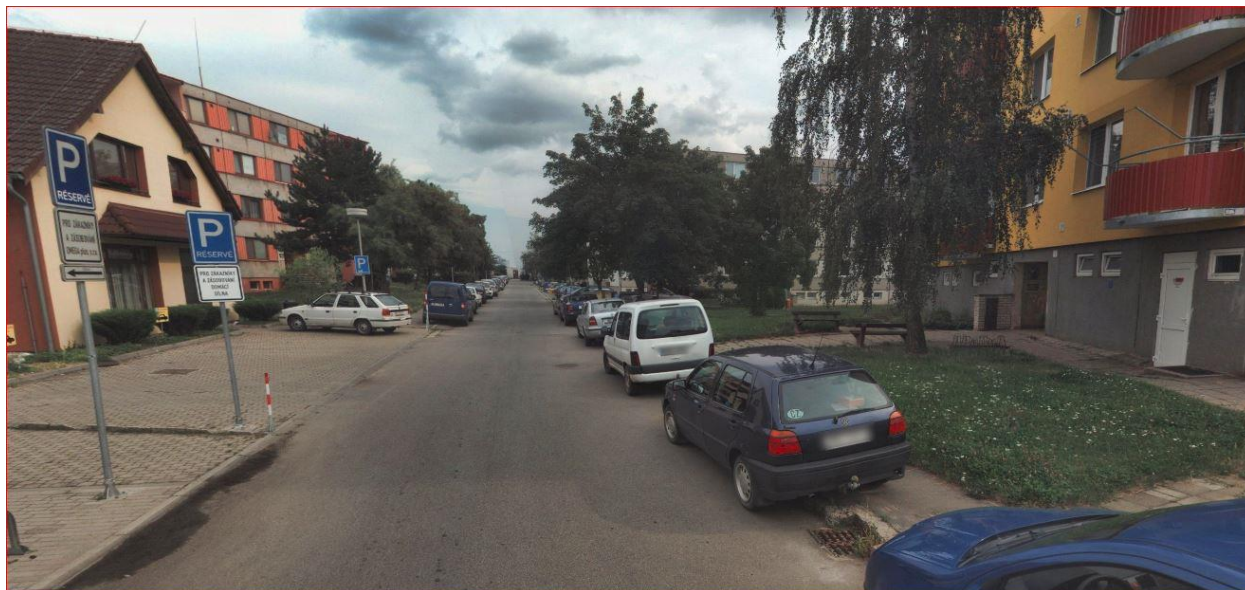
Obrázek 8 - stání na komunikaci, nedostatečná šířka komunikace

parkování vozidel. Osobní auta parkují na silnicích, kde blokují dopravu, dále parkují na zatravněných plochách, případně na chodnících. Kladem tohoto sídliště, nepříliš vysoká zahuštěnost a poměrně velká bezpečnost.