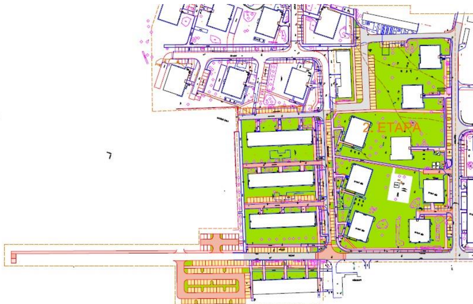
Obrázek 2 – návrh situace – etapa 2