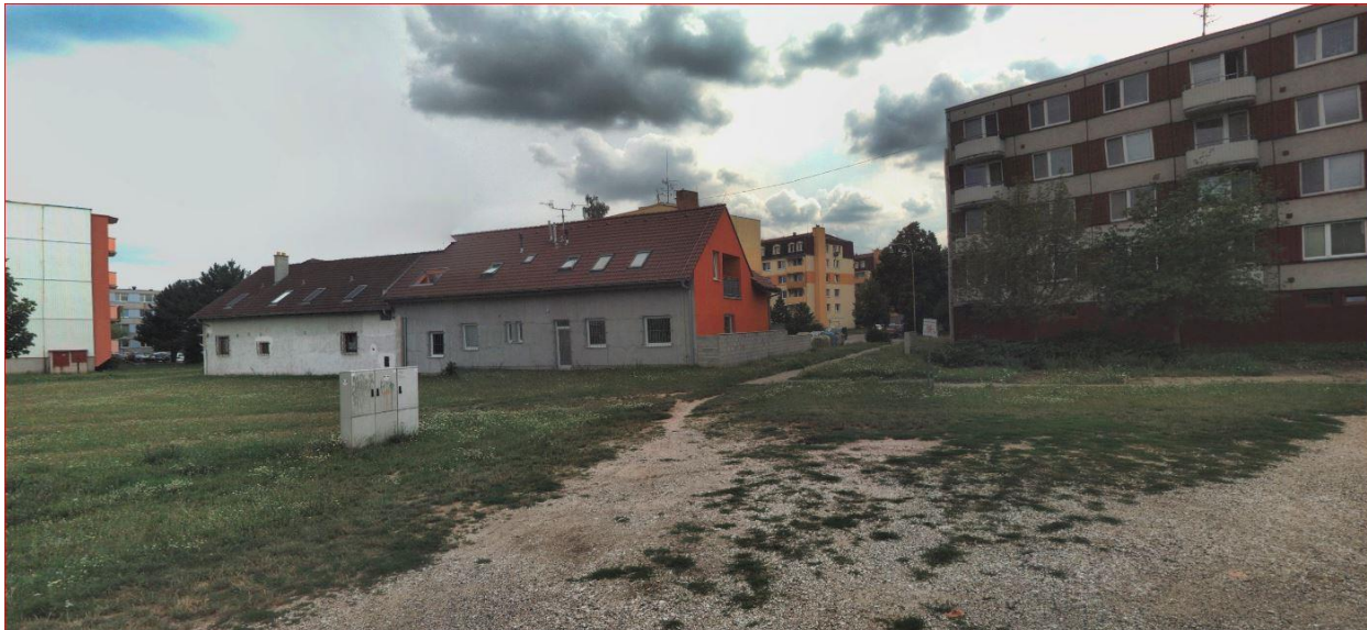
Obrázek 9 – stávající nezpevněná plocha, kde vznikne nové parkoviště

budou na kraji parkovacího bloku, aby byl umožněn jejich bezbariérový přístup na chodník. V tomto místě bude snížený obrubník s převýšením + 2 cm. Povrch parkovacích stání bude tvořen betonová zámková zatravnovací dlažba tl. 8 cm, která bude vyplněna drtí fr. 4/8.