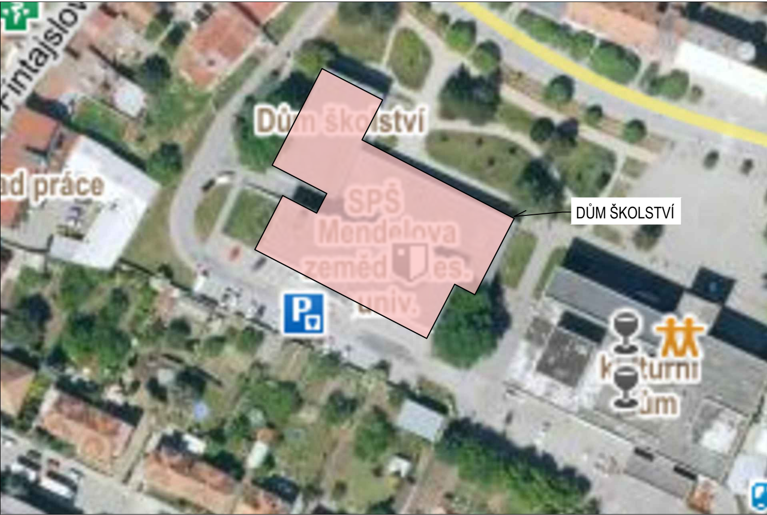
Ortofoto M 1:1000