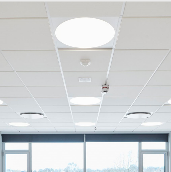
VIDITELNÝ ZAPUŠTĚNÝ ROŠT - STÍNOVÝ EFEKT